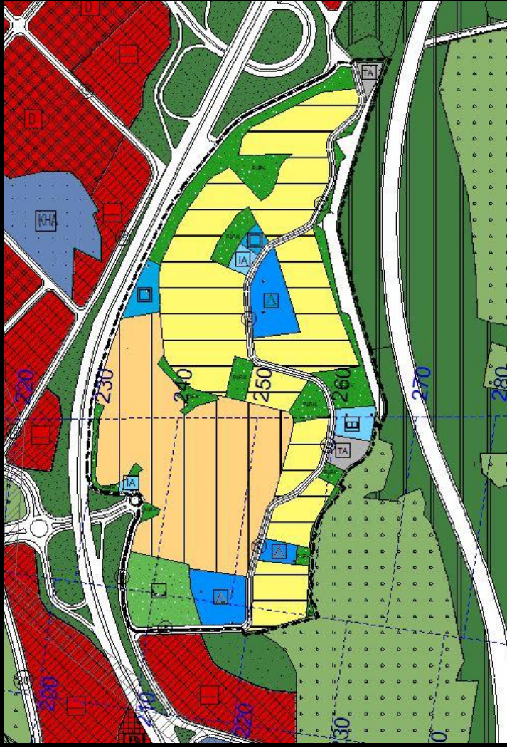
Şekil 4: 1/5000 Ölçekli Plan Değişikliği Örneği

Değişen Arazi Kullanım değerleri Tablo 1’de gösterilmiştir.