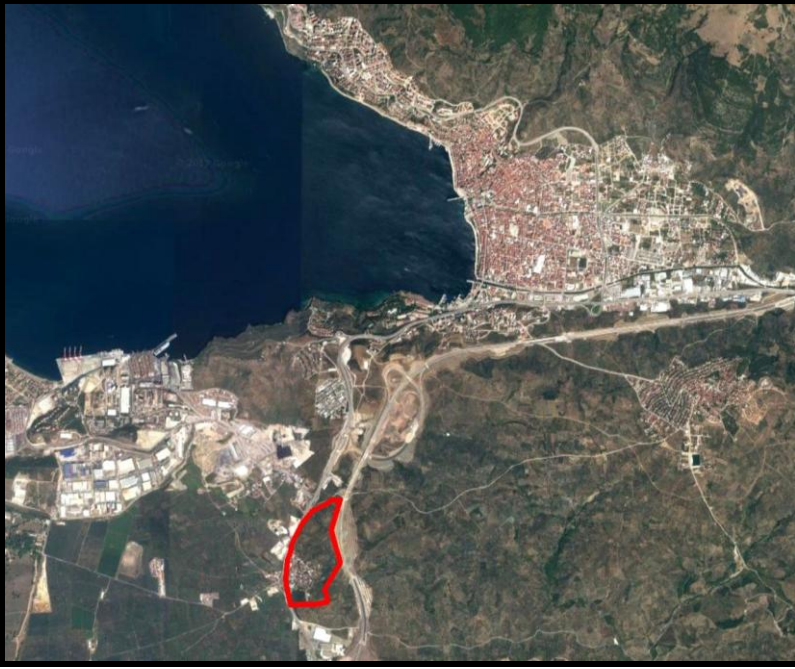
Harita 2: Plan Değişikliğine Konu Alanın Uydu Görüntüsü